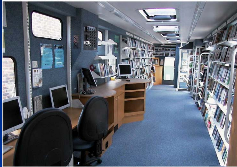
East Riding of Yorkshire, Inglaterra

A biblioteca móvel é um mini-biblioteca e deverá ter a maior parte dos equipamentos disponíveis numa biblioteca fixa É necessário um fundo equilibrado e flexível