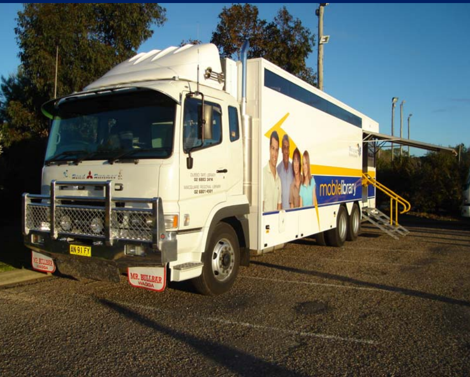
Dubbo New South Wales Austrália