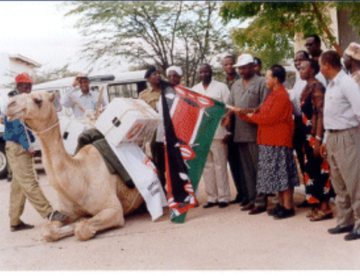
Camelos no Quênia