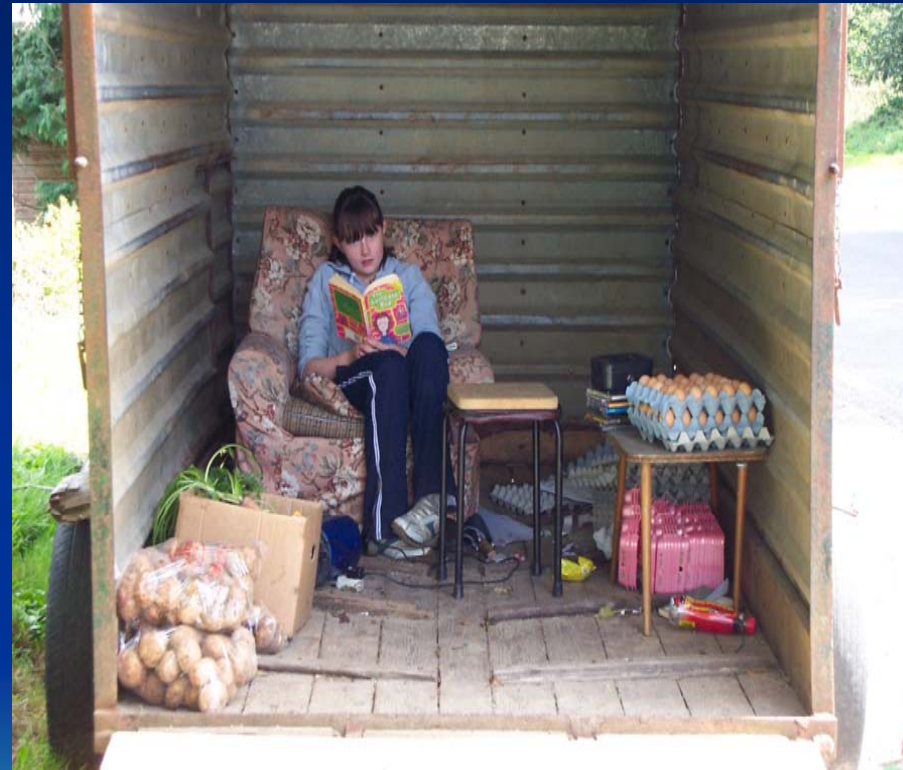
County Kerry, Irlanda

A biblioteca móvel é bastante flexível e as suas rotas podem ser facilmente alteradas para acompanhar as alterações de