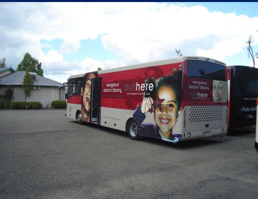
Wanganui Serviço de Biblioteca