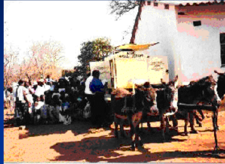
Burros no Zimbabué