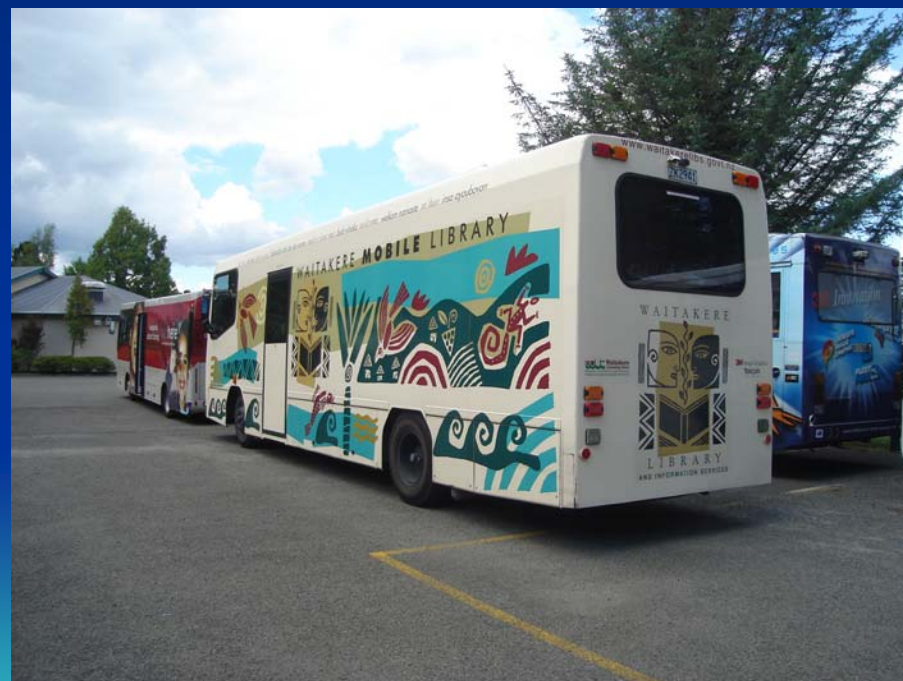
Waitakere Serviço de Biblioteca